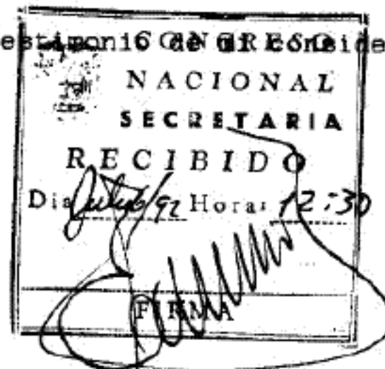
Rodrigo Borja PRESIDENTE DE LA REPUBLICA