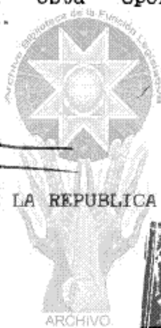
Rodrigo Borja PRESIDENTE DE LA REPUBLICA