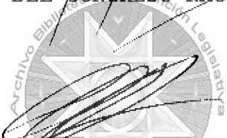
Pepe Miguel Mosquera Murillo SECRETARIO GENERAL DEL CONGRESO NACIONAL