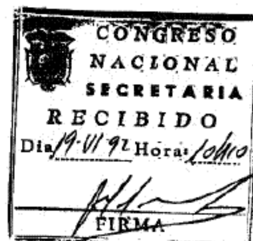
Rodrigo Borja PRESIDENTE DE LA REPUBLICA