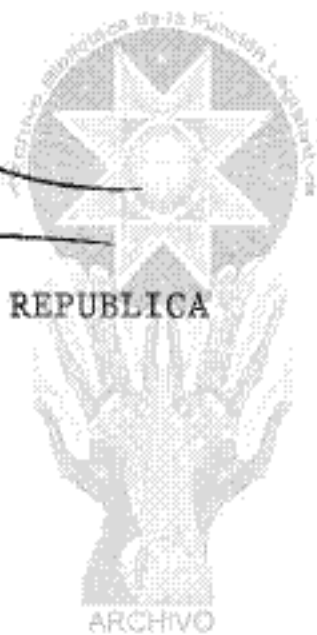
Rodrigo Borja PRESIDENTE DE LA REPUBLICA