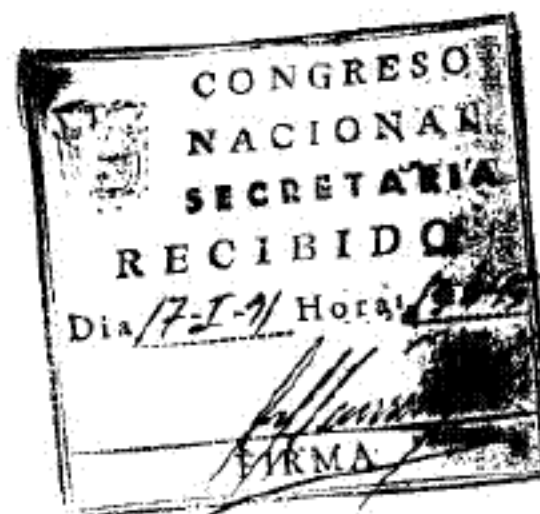
Rodrigo Borja PRESIDENTE DE LA REPUBLICA