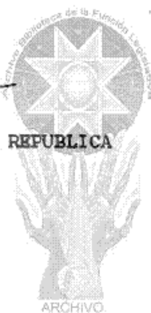
Rodrigo Borja PRESIDENTE DE LA REPUBLICA