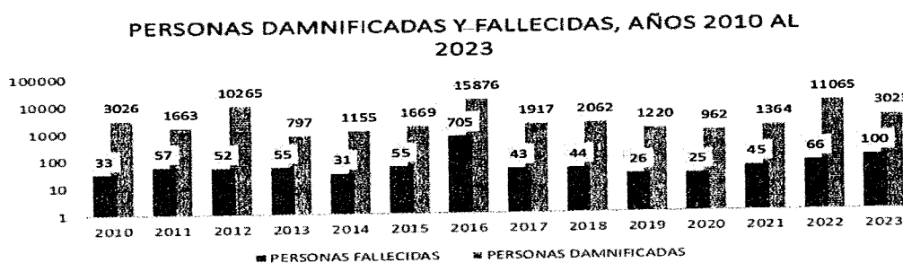
Ilustración 1. Personas fallecidas y damnificadas por año. -----